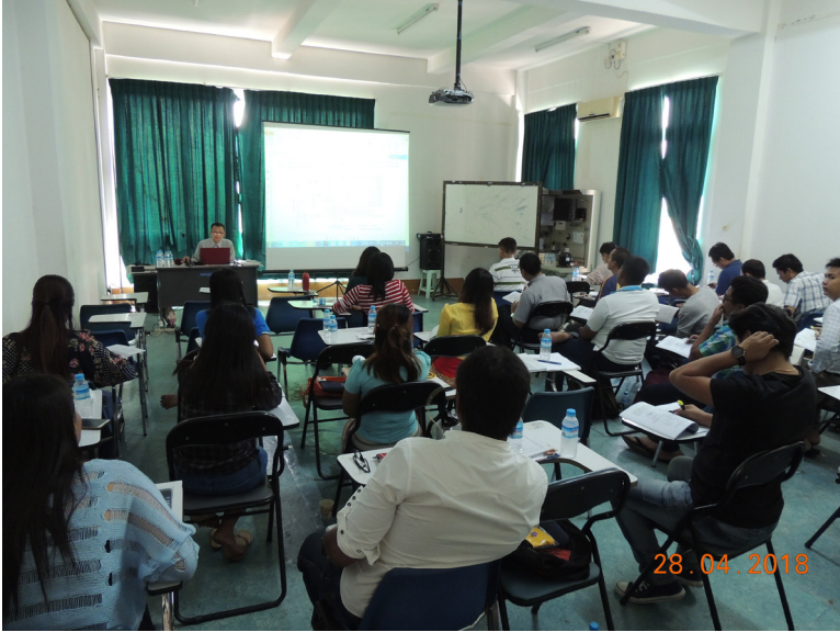
ဧပြီလ(၂၈)ရက် နေ့က Training Room တွင် 1st Batch of Welding Engineer (WE) Course Training Lecture ပြုလုပ်သည်။