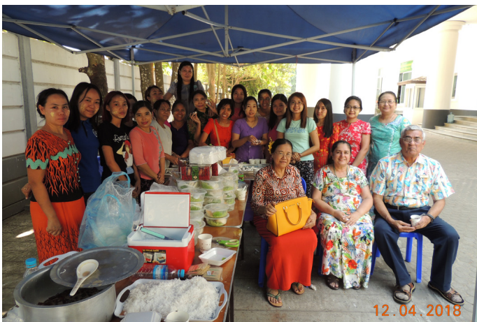
ဧပြီလ(၁၂)ရက်နေ့က MES ဝန်ထမ်းများ သင်္ကြန်အကြို အလှူလုပ်ပါသည်။