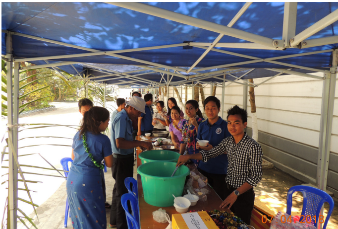
ဧပြီလ(၇)ရက်နေ့က YE သင်္ကြန်အကြိုအလှူလုပ်ပါသည်။

Myanmar Engineering Council သည်အင်ဂျင်နီယာပညာရှင်များအရည်အသွေး စိစစ်မှတ်ပုံတင်ထုတ်ပေးရေးနှင့် အင်ဂျင်နီယာပညာရေး အရည်အသွေးအာမခံမှု အသိအမှတ်ပြုရေးတို့အတွက် နိုင်ငံတကာနှင့်ဒေသဆိုင်ရာအပြန် အလှန်သဘောတူညီချက်များအရ ပြည်ထောင်စု လွှတ်တော်က ဥပဒေပြဋ္ဌာန်း၍ ပြည်ထောင်စုအစိုးရကဖွဲ့စည်း ပေးသော ပြည်ထောင်စုအဆင့်ထိန်းသိမ်းကွပ်ကဲမှု အာဏာပိုင်အဖွဲ့ (Union Regulatory and Statutory Body) ဖြစ်ပါသည်။ ထိုက်သင့်သည့် လုပ်သက်ရရှိပြီးသော အင်ဂျင်နီယာဘွဲ့ /ဒီပလိုမာရယူထားပြီး အင်ဂျင်နီယာပညာဖြင့် အသက်မွေးဝမ်းကျောင်းပြုသူများသည် အများပြည်သူများဘေးကင်းလုံခြုံရေးအတွက် ဥပဒေဖြင့်ကန့်သတ်ထားသော အင်ဂျင်နီယာလုပ်ငန်းများ ကြီးကြပ်လုပ်ဆောင်ခွင့်လက်မှတ် ထုတ်ပေးနိုင်သော အဖွဲ့အစည်းဖြစ်ပါသည်။