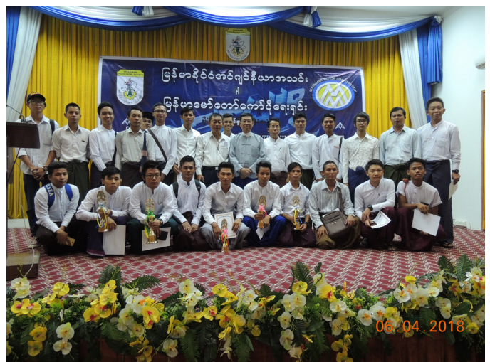
ဧပြီလ(၆) ရက်နေ့က Function Hall တွင် Certification Ceremony of Automobile Training ပြုလုပ်သည်။