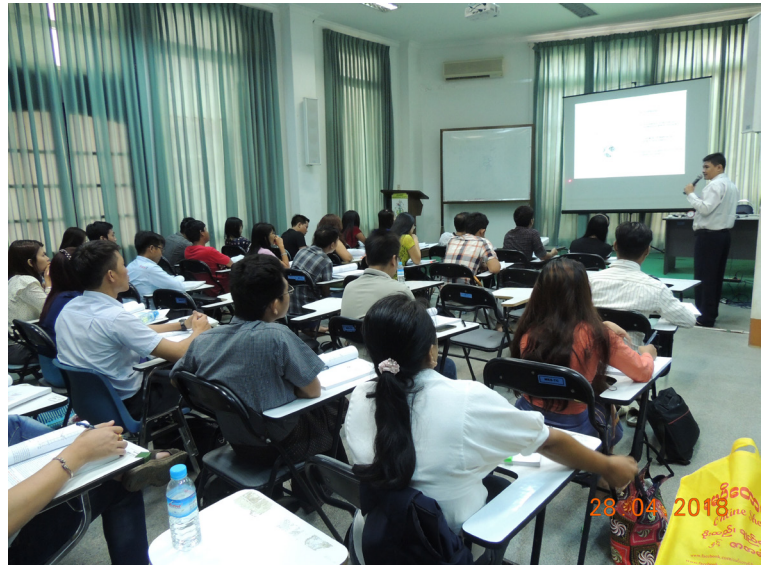
ဧပြီလ(၂၈)ရက်နေ့က Seminar Room တွင် 3rd Batch of Welding Engineer (WE) Course Training Lecture ပြုလုပ်သည်။