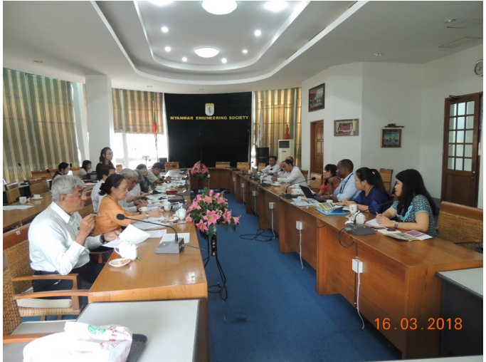
မတ်လ (၁၆) ရက်နေ့က MES Conference Room တွင် Myanmar Earthquake Committee နှင့် UNDP အစည်းအဝေး ပြုလုပ်ပါသည်။