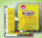
Digestive Tablet (small package)