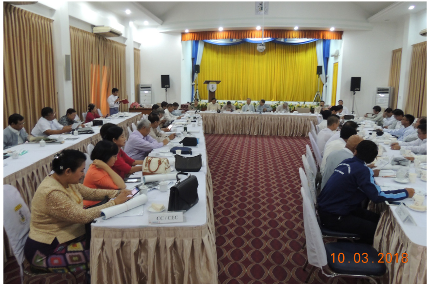
မတ်လ (၁၀) ရက်နေ့က MES Function Hall တွင် ပထမသုံးလပတ် ဗဟိုကော်မတီဝင်များနှင့် MES Chapter များ အစည်းအဝေး ပြုလုပ်ပါသည်။