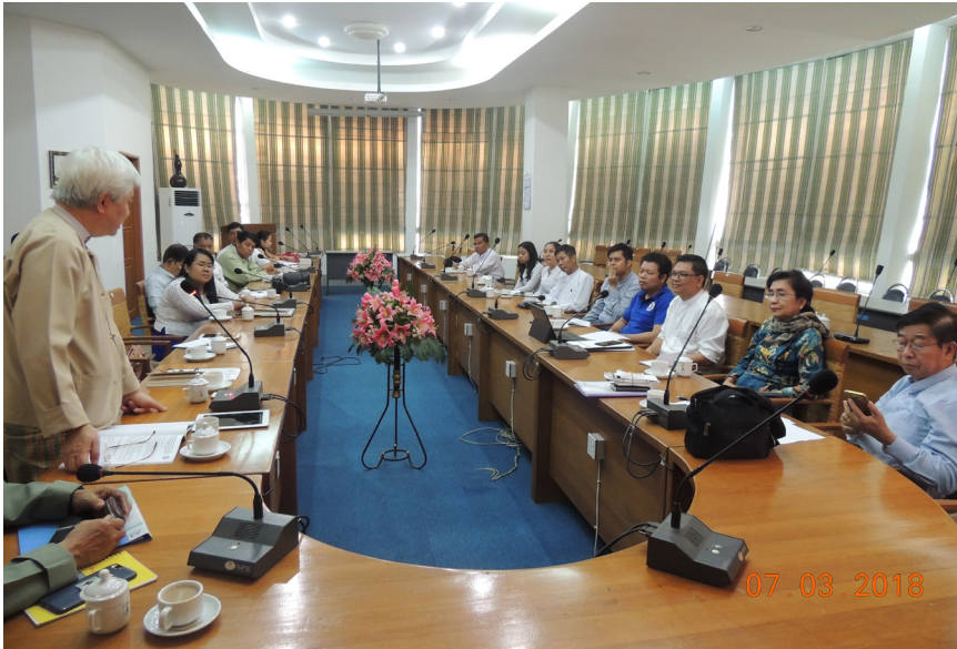
မတ်လ (၇) ရက်နေ့က MES Conference Room တွင် “Coordination Meeting for ASEAN Energy Award” ပြုလုပ်ပါသည်။