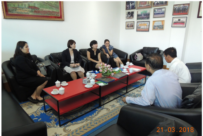
မတ်လ (၂၁) ရက်နေ့က MES President Office တွင် “Meeting between MES and UBM တွေ့ဆုံဆွေးနွေးကြပါသည်။