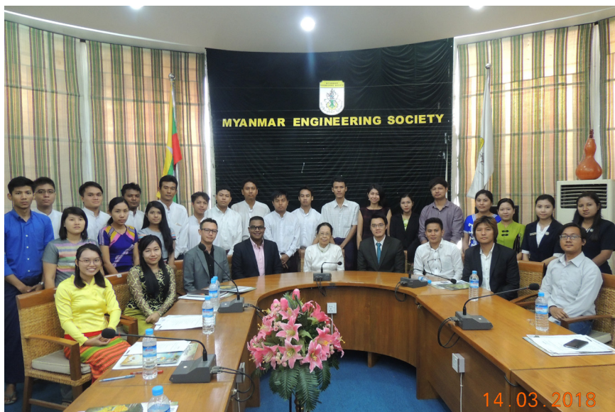
မတ်လ(၁၄)ရက်နေ့ကMES Conference Room တွင် Meeting between with Myanmar Earthquake Committee and GIS (Thailand) တို့ပြုလုပ်ပါသည်။